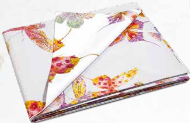
SACCO COPRIPIUMINO DOUBLE MATRIMONIALE