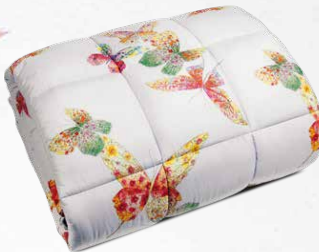
TRAPUNTA DOUBLE MATRIMONIALE

fondo grigio e farfalle multicolor dall'altro.