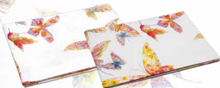
LENZUOLO SOPRA SINGOLO