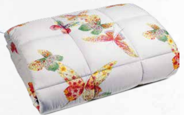
TRAPUNTA DOUBLE SINGOLA

Fondo grigio e farfalle multicolor dall'altro lato.