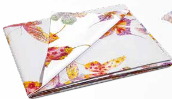
SACCO COPRIPIUMINO DOUBLE SINGOLO