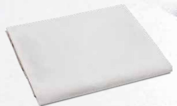
LENZUOLO SOTTO CON ANGOLI SINGOLO