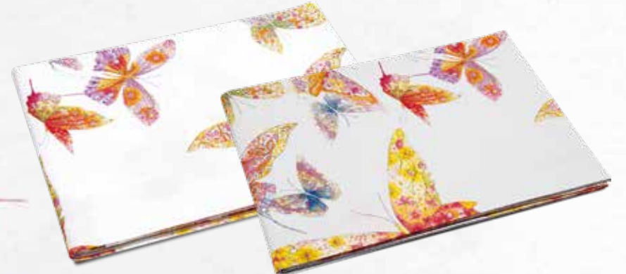
LENZUOLO SOPRA MATRIMONIALE