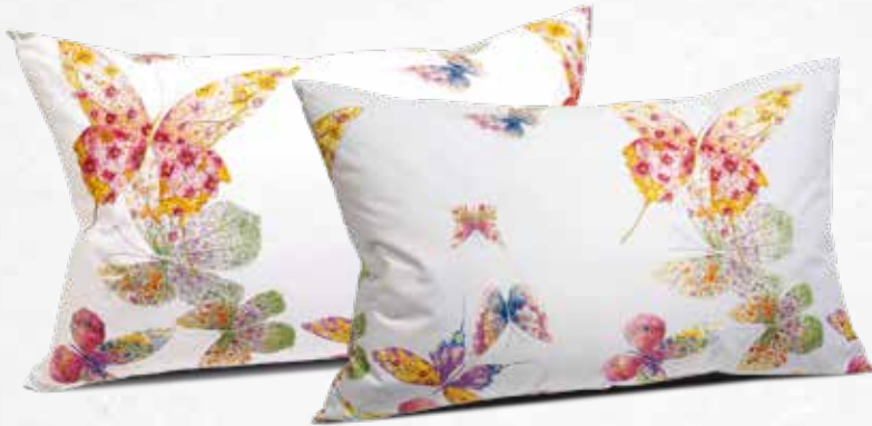
FEDERA A SACCO

NUOVA RACCOLTA BOLLINI DAL 16 LUGLIO AL 7 OTTOBRE